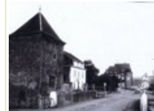
An der Béiwerei