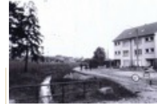
Ëmert dem Wues