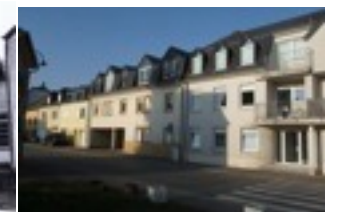
Rue de Mamer