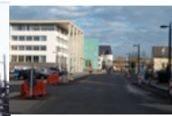
Bei der Gemeng