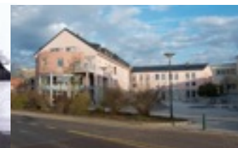
«Bei den Hinger»