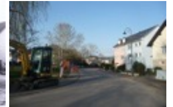
Rue de la Pétrusse