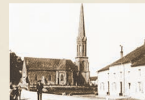
Kierch géint 1920