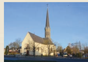
Eglise de Bertrange 2013