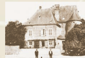
D'Schauenbuerg géint 1920