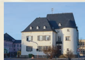
Schauenbourg de Bertrange 2013