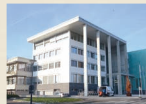
Commune de Bertrange 2013