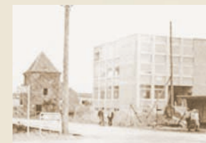
Bei der Gemeng géint 1974