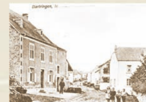
Am Wénkel 1920