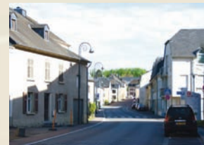
Rue de Mamer 2013